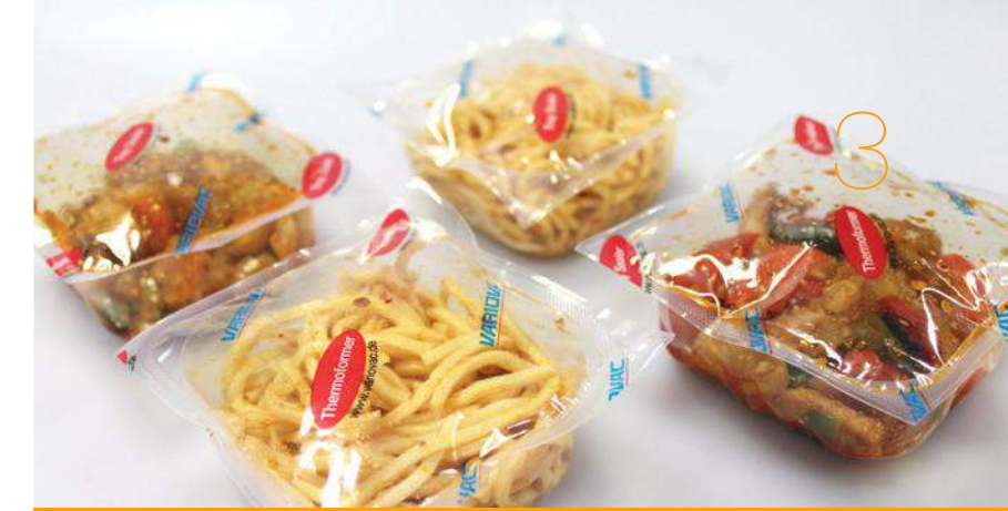
MAP (Modified Atmosphere Packaging) - Asia Food

Verpackungsleistungen von 13 Takten pro Minute bei brillanter Ausformung und bester Restfolienstärke werden mit der Optimus problemlos erreicht. Hartfolien bis zu 500 µ werden mit dem VARIOVAC RAPID AIR SYSTEM zu perfekten Schalen geformt.