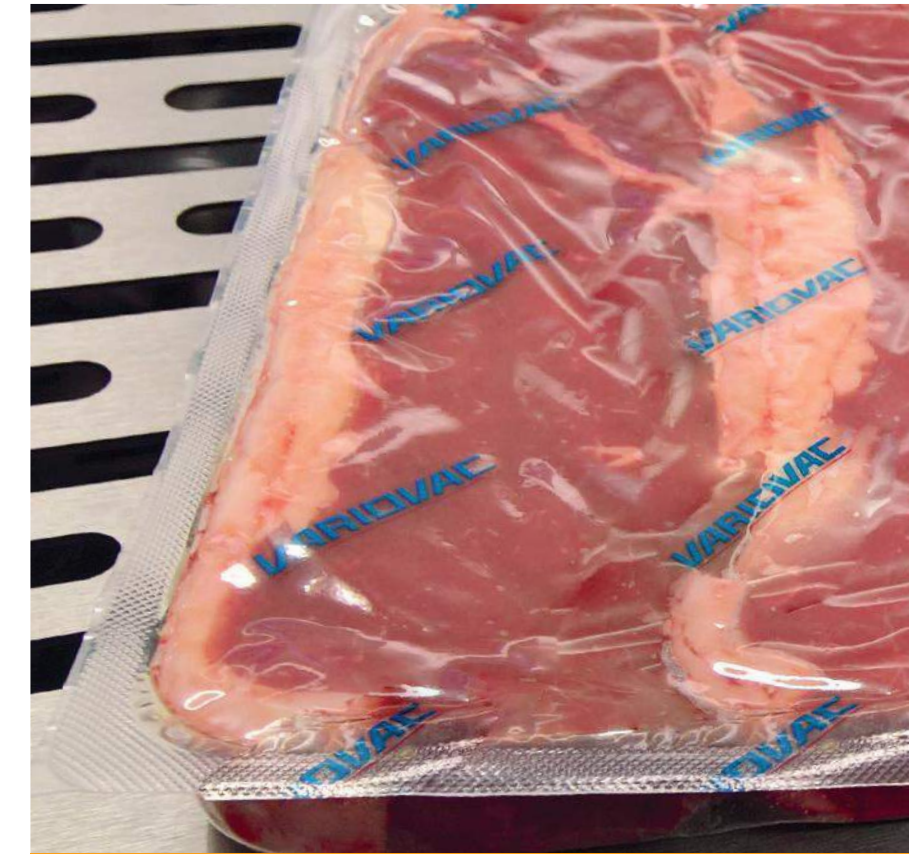
Vakuumverpackung - Steak