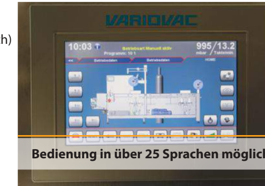
Bedienung in über 25 Sprachen möglich