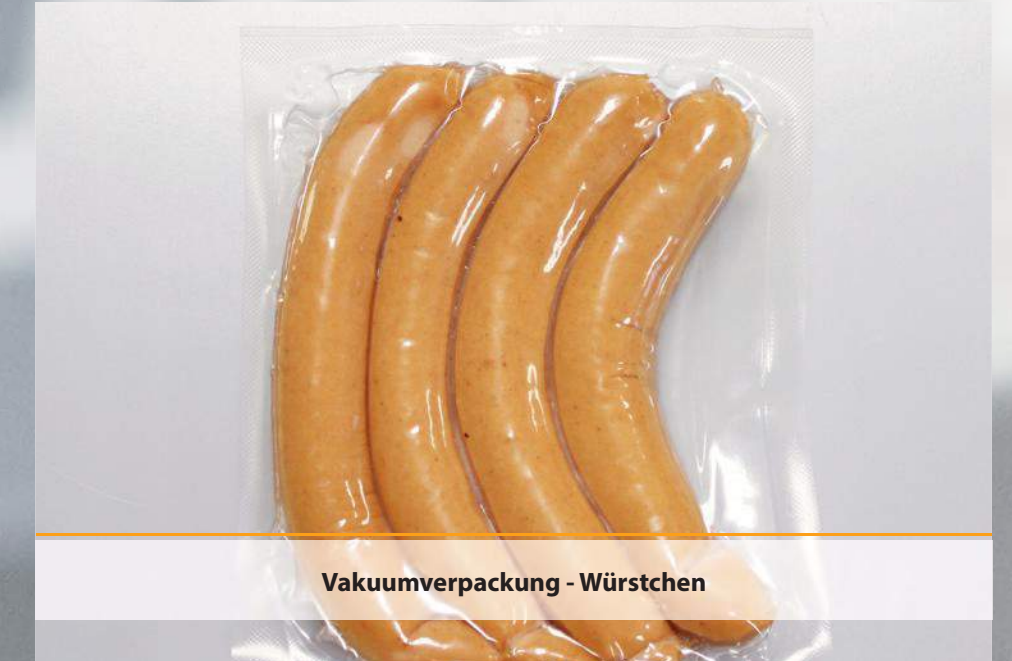
Vakuumpackung - Würstchen