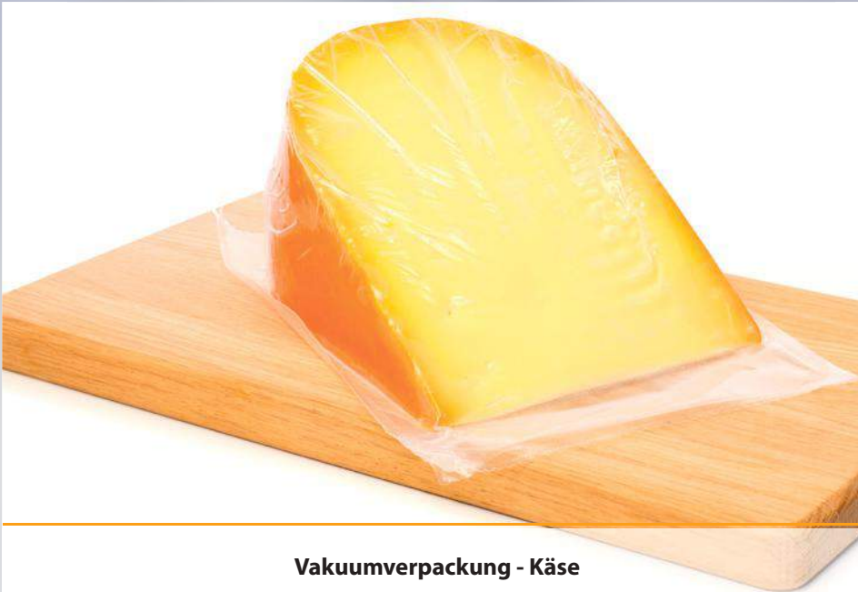
Vakuumverpackung - Käse