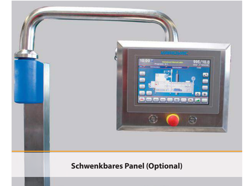
Schwenkbares Panel (Optional)