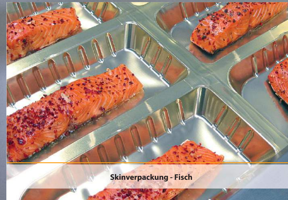
Skinverpackung - Fisch